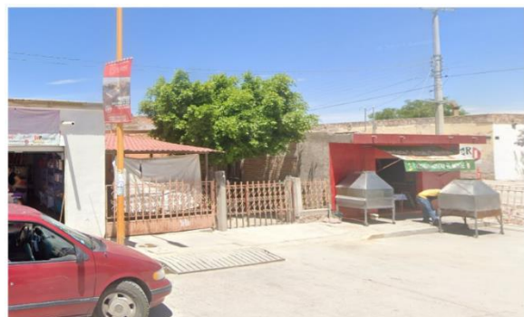
La imagen hace referencia al domicilio ubicado Calle 20 de Noviembre Centro, de Palo Alto, El Llano, Aguascalientes.