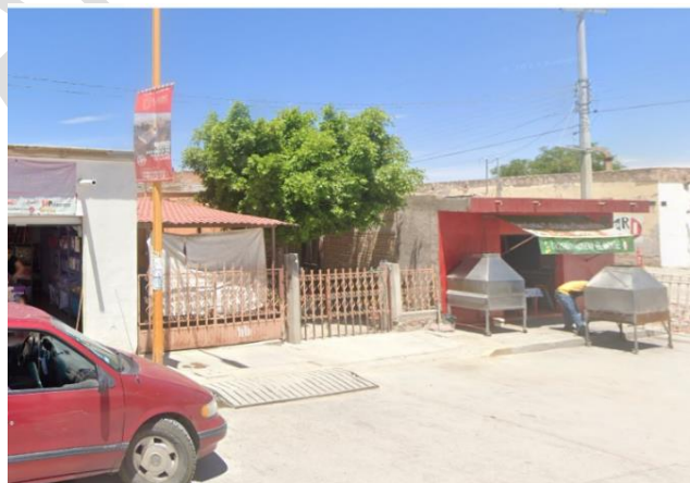
La imagen hace referencia al domicilio ubicado Calle 20 de Noviembre Centro, de Palo Alto, El Llano, Aguascalientes.